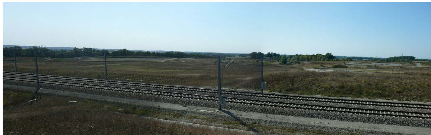
PC8-2 Vue du site depuis la zone du Plessis, au Nord-Est