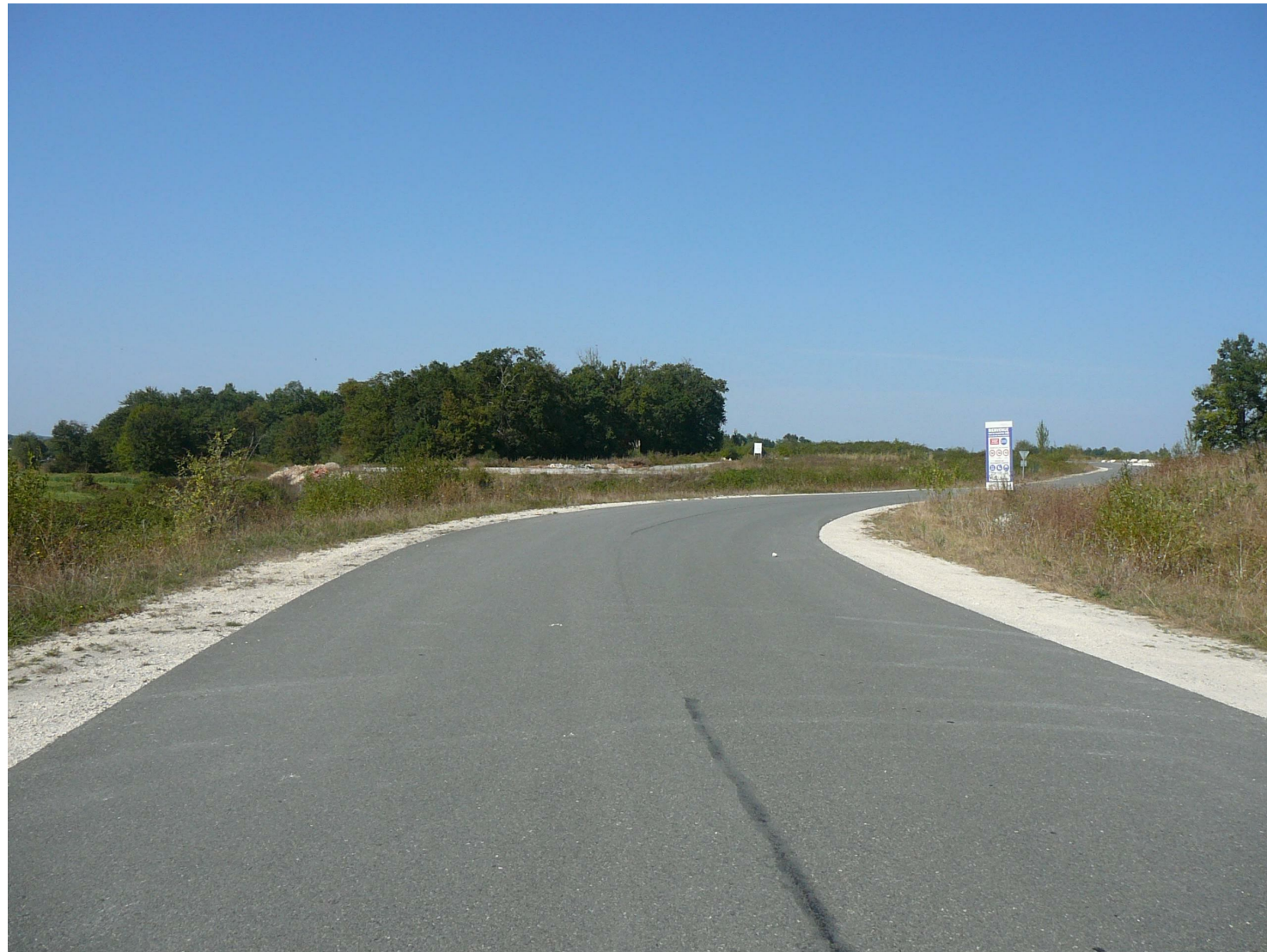
PC8-1 Vue de la voie d'accès au site, au Sud